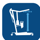
Lyftintervall (med lyftarmen i kortaste/ längsta läget) ▼