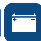
Antal lyft per laddning)** ▼